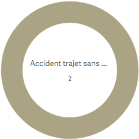
Répartition Typologie en Volume